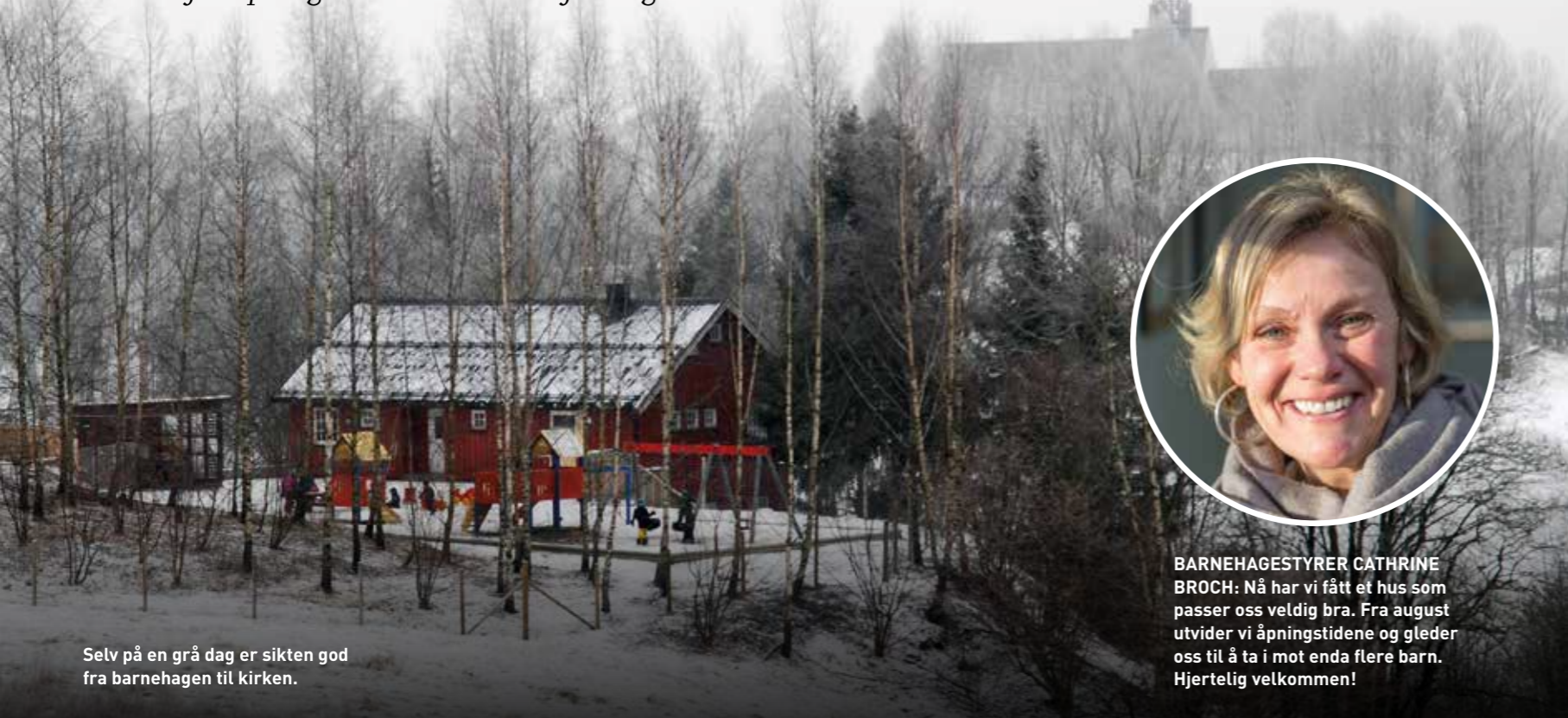
Selv på en grå dag er sikten god fra barnehagen til kirken.

Trivselen ble med på lasset da barnehagen flyttet. Det viktigste forandrer seg ikke. Bortsett fra åpningstidene. De utvides fra august.